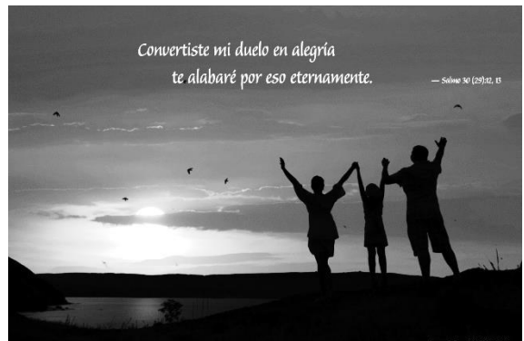
Convertiste mi duelo en alegría te alabaré por eso eternamente. — Salmo 34 (29)11, 13

Gracias a nuestros parroquianos quien han apoyado con sus promesas y regalos a la Campaña Anual del Obispo. Estamos al 53% de nuestra meta de $35,000. Si usted no ha hecho su promesa aun, llene una tarjeta con su promesa y apoye a nuestra iglesia diocesana.