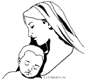
Mary, Mother of God

The Solemnity of Mary the Mother of God is Sunday, January 1. Masses will be the same as our usual weekend schedule. The Parish Office will be closed Monday, January 2.